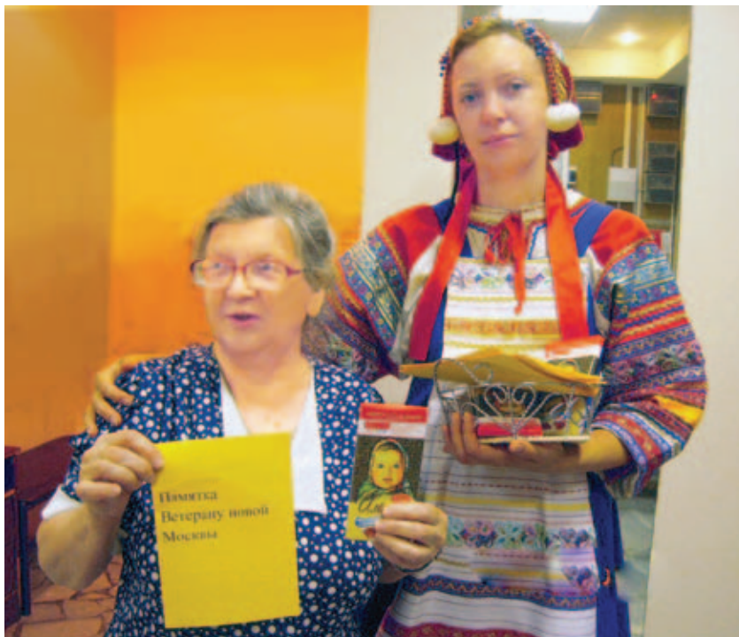
Встреча с представителями Совета ветеранов п. Первомайское

В посёлке Ватутинки, в отделении дневного пребывания, тоже появится Мобильная социальная служба. Глава администрации поселения уже пообещал выделить для неё отдельное помещение.