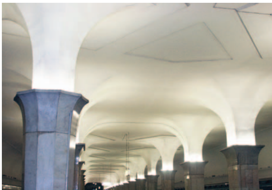
Храмовым зодчеством Древнего Египта навеян и архитектурный образ одной из станций Московского метрополитена – «Кропоткинская»