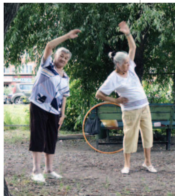
Физкультура на свежем воздухе

Ещё одно новое отделение – реабилитационное, рассчитанное на людей с ограниченными возможностями здоровья. Департамент социальной защиты населения города Москвы помог с приобретением специального оборудования.