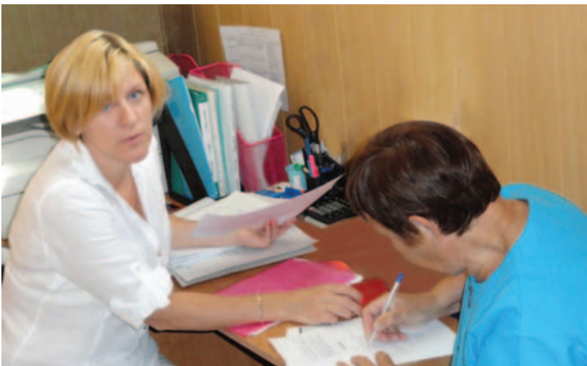
Оформление адресной помощи

Скорая социальная помощь придёт также в посёлки Первомайское и Киевский. А с 1 июля здесь работают Клиентская служба и отделения на дому центра социального обслуживания.