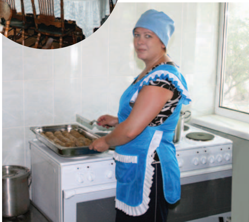
Обед в столовой ЦСО «Нагатинский затон»