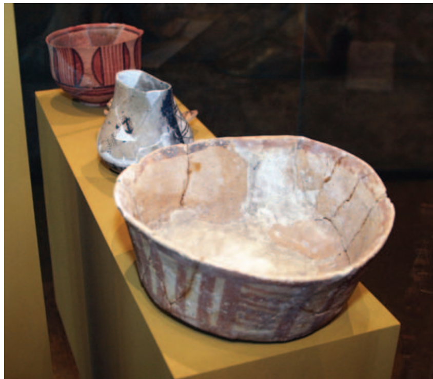
Этой керамической посуде из Северного Ирака более 7 тысяч лет, она принадлежит эпохе, ещё не знавшей гончарного круга