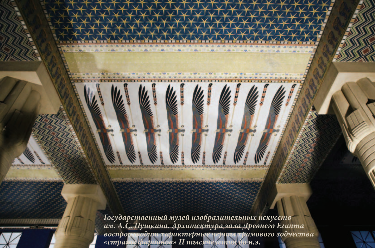
Государственный музей изобразительных искусств им. А.С. Пушкина. Архитектура зала Древнего Египта воспроизводит характерные черты храмового зодчества «страны фараонов» II тысячелетия до н.э.