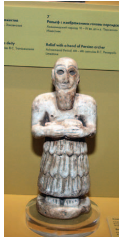
Статуэтка человека шумерского периода (середина III тысячелетия до н.э.)