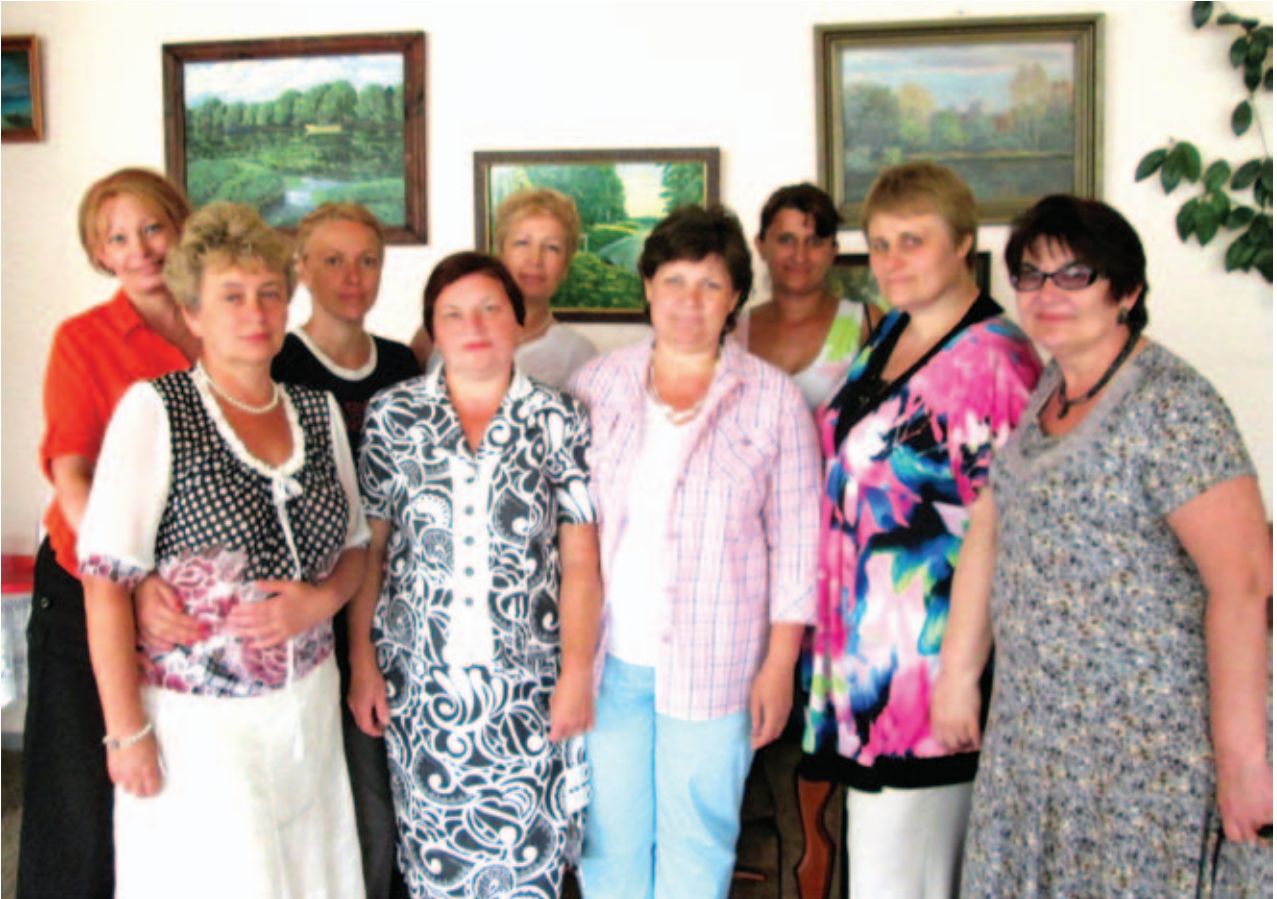
Встреча коллег – заведующих отделений на дому московских поселений

На присоединённых к Москве территориях проживают 233 тысячи человек, из которых 77 тысяч – относятся к числу льготных категорий