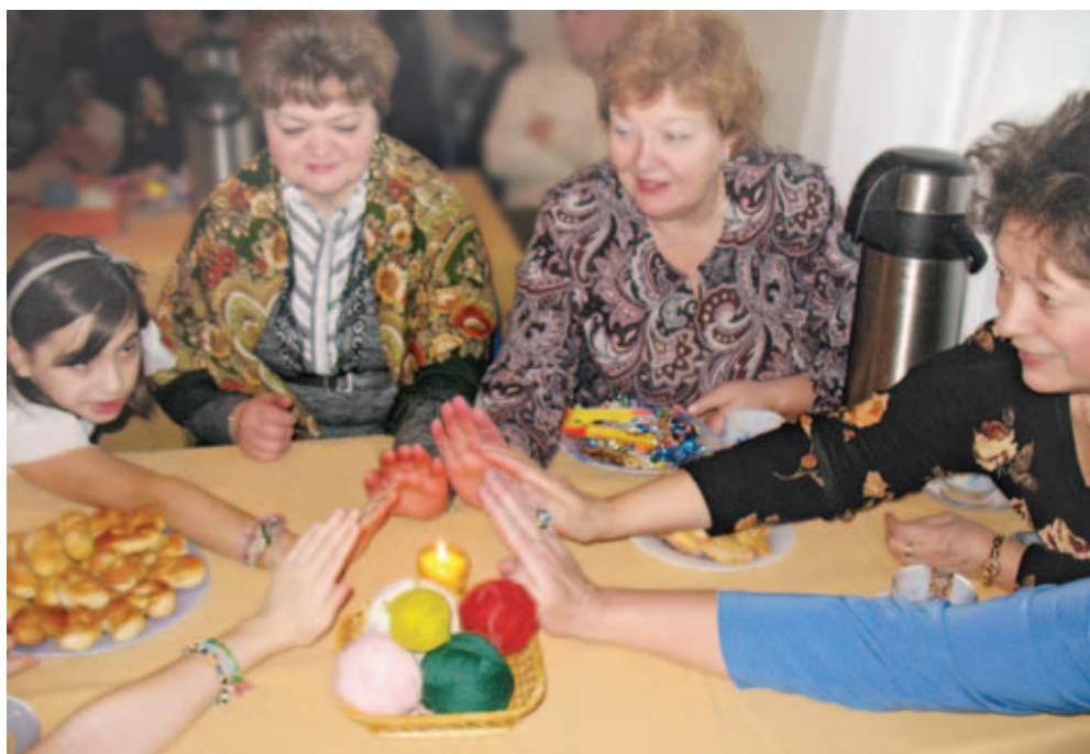
Дарите тепло своих рук друг другу

«Раньше как было? Если сам себе не свяжешь, например, носки, так и будешь ходить босым. А в мороз – это ой как непросто! Вязать-то я научилась еще в школе. Сколько помню себя, все время вяжу», – делится пенсионерка. Она посещает ТЦСО №11 два года. И вместе с мастерицами из кружка рукоделия участвует в различных выставках и акциях. Между