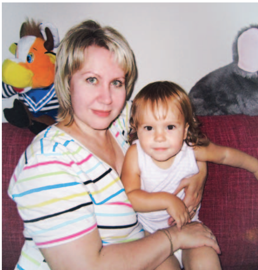
С любимой внучкой Варварой

Когда путешествую, вижу разные проблемы, не могу отвлечься от них и на отдыхе. Обнадуживает то, что в октябре Президент РФ В.В. Путин обратил внимание глав регионов на эту проблему, сказал, что зарплата социальных работников не соответствует интенсивности труда, что она составляет 30–35% от средней по России и с 2013 года доходы социальных работников необходимо повысить. Надеюсь, что к нашим коллегам в регионах проявят должное внимание.