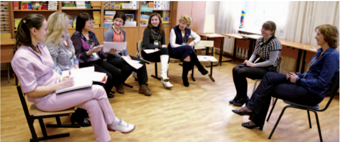
Участники конференции обменялись опытом работы с семьями, воспитывающими детей-инвалидов

Психологи-консультанты предлагают родителям (опекунам, попечителям), имеющим детей-инвалидов, новую форму общения с целью обмена информацией, технологиями «самопомощи», опытом воспитания и развития детей в режиме онлайн-партнерства и взаимодействия. В условиях интернет-форума семьи могут обсуждать трудности, проблемы, успехи и достижения своих детей. Также на форуме имеется необходимая методическая информация: информационно-просветительные материалы для развития детей с ограниченными возможностями здоровья и воспитания «ответственного родительства», предложения специалистов по организации и проведению домашних занятий.