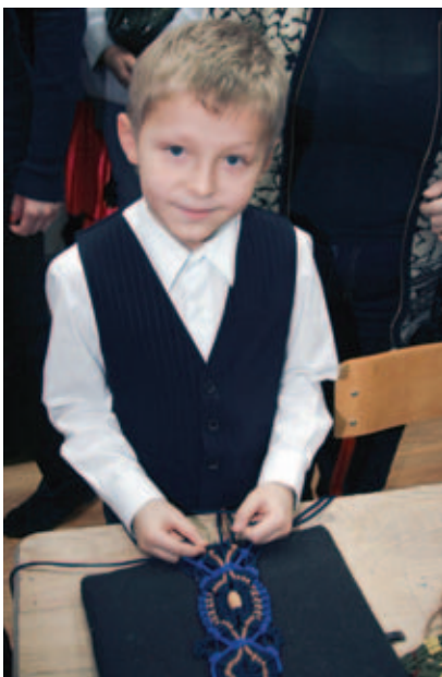
Фрол дает мастер-класс по макраме

решили взять не из московского учреждения, а из другого региона.