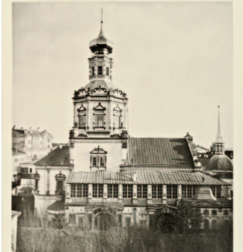
Богоявленский храм Богоявленского монастыря. Фото Найденова, 1882–1883 г.г.

В 1866 году из русского Пантелеимонова монастыря на Афоне привезли икону Божией Матери «Скоропослушница», а также части мощей целителя Пантелеимона, крест с частицей Животворящего Древа, частицу камня Гроба Господня. Чтобы приложиться к этим святыням, в Богоявленский монастырь стекался люд