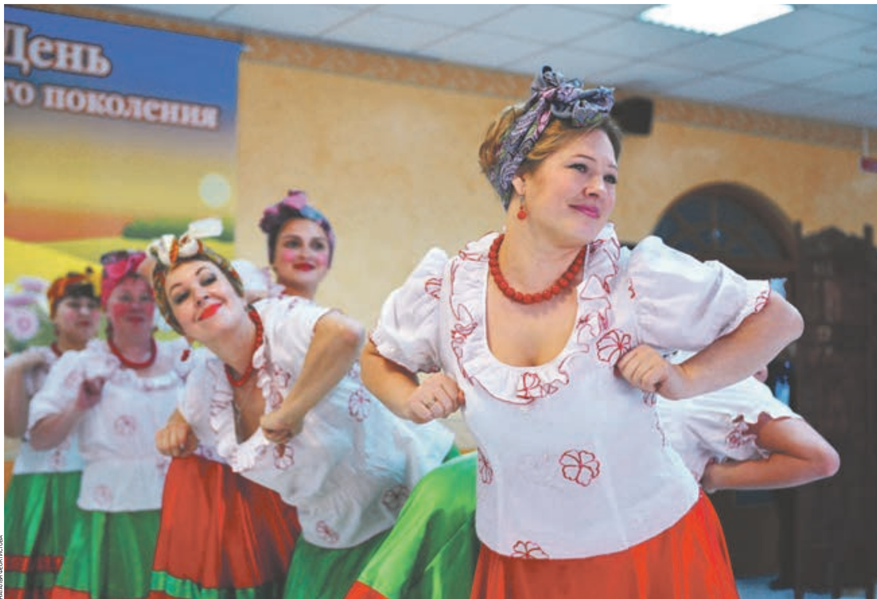
1 октября 2016 года 11:44 День открытых дверей в пансионате для ветеранов труда № 31 в Конькове. Гостей встречали с песнями и танцами

В корпусе медико-оздоровительного центра проводятся занятия в бассейне, оборудованном подъемником для людей с ограниченными возможностями здоровья. В водолечебнице можно получить множество поистине целеб-