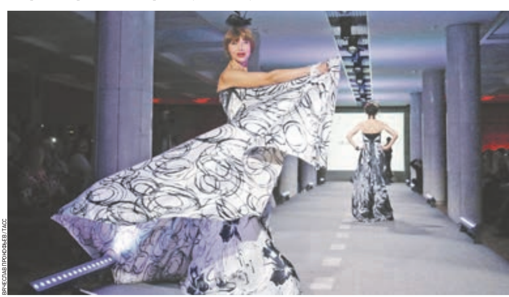
6 октября 2016 года 17:10 Манекенщиц без опыта на подиуме поддержали ветераны модельного бизнеса. Например, Елена Метелина, известная всем по главной роли в фильме «Через тернии к звездам»