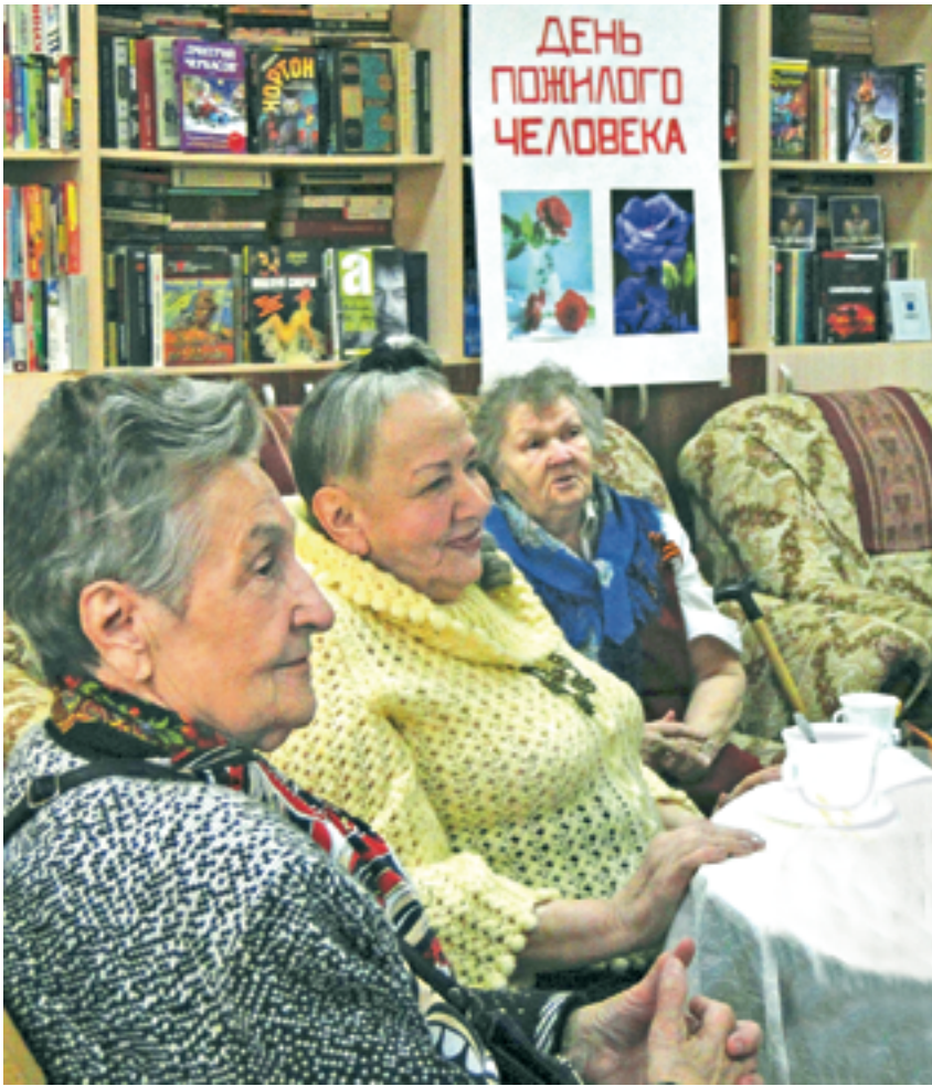
В библиотеке регулярно проходят лекции, беседы, клубы по интересам