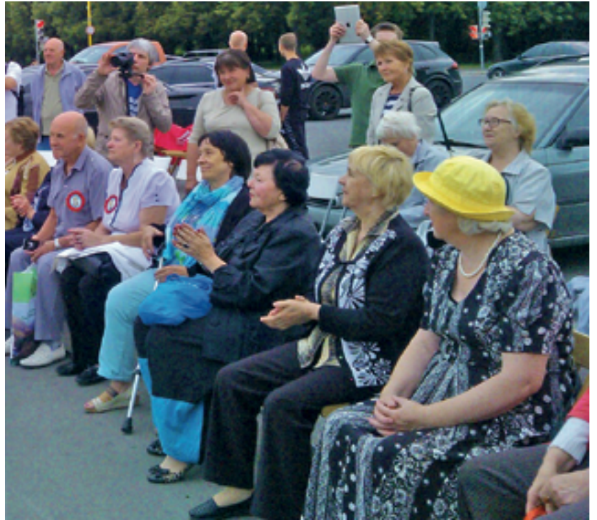
Ралли на Воробьевых горах с участием подопечных ТЦСО «Марьино»

зонты общения». В рамках программы «Университет третьего возраста» начал работу клуб «Театр мод». Ежемесячное дефиле знакомит зрителей с новинками народных кутюрье. Шали, накидки, пончо, кофты и шляпки, украшенные бисером, кожей, стразами, лентами прекрасно смотрятся на моделях, хорошо освоивших «французский» шаг и другие премудрости передвижения по подиуму.