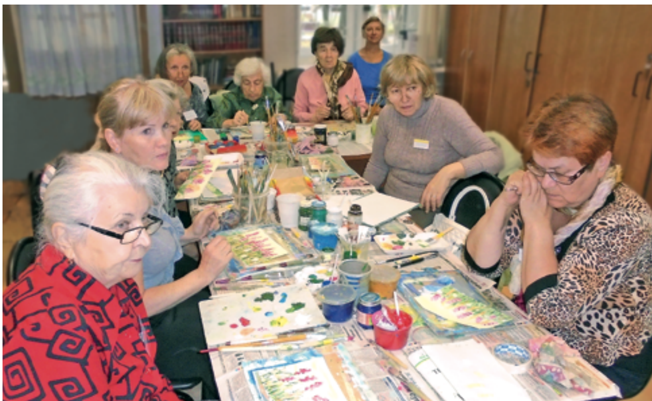
Тема занятия — осенний пейзаж