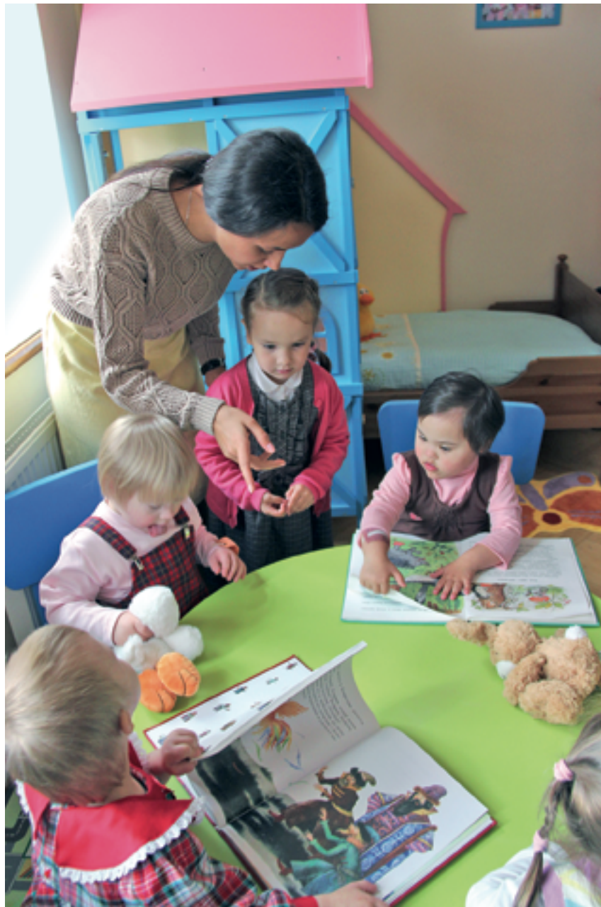
К приезду ребятишек заботливо обустроены жилые, игровые и сенсорные комнаты

Ну и какой же праздник без угощения? Новичков пригласили в трапезную на праздничный обед, приготовленный с любовью и заботой. Пока малы-