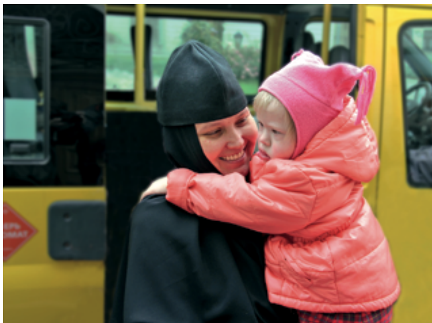
В жизни шести малышек с синдромом Дауна открылась новая страница

Помочь в воспитании, развитии и социализации малышек с синдромом Дауна, а главное, постараться найти для них приемных родителей — такую благую цель поставили перед собой сотрудники православного Елизаветинского детского дома, действующего при Марфо-Мариинской обители милосердия. Доброе начинание поддержали в Департаменте труда и социальной защиты населения города Москвы и православной службе помощи «Милосердие». И вот Елизаветинский детский дом гостеприимно распахнул двери для новых обитателей — сюда привезли шесть девочек из Детского дома-интерната № 7 города Москвы.