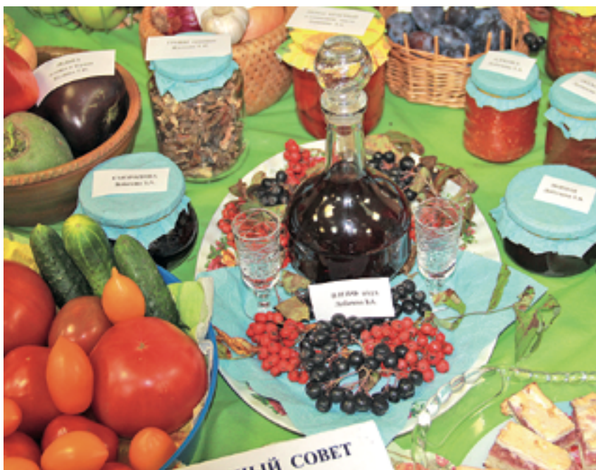
Часть экспозиции была доступна для дегустации