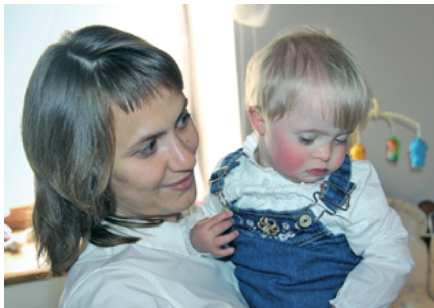
«Солнечные» дети не особенно отличаются от сверстников

детей — их усыновляют или берут в приемные семьи. Но большинство детей-инвалидов так и остаются в детском доме, а после 18 лет их, как правило, помещают в психоневрологический интернат. И мы подумали — почему бы не попытаться определить в приемные семьи ребятишек с синдромом Дауна? Это замечательные, радостные, добрые дети, которых при должном воспитании можно сделать полноценными членами общества, дать возможность жить самостоятельной насыщенной жизнью. Наш проект — шанс на успешное будущее для этих детей. Очень хочется сделать их счастливыми, думаю, что и они будут ра-