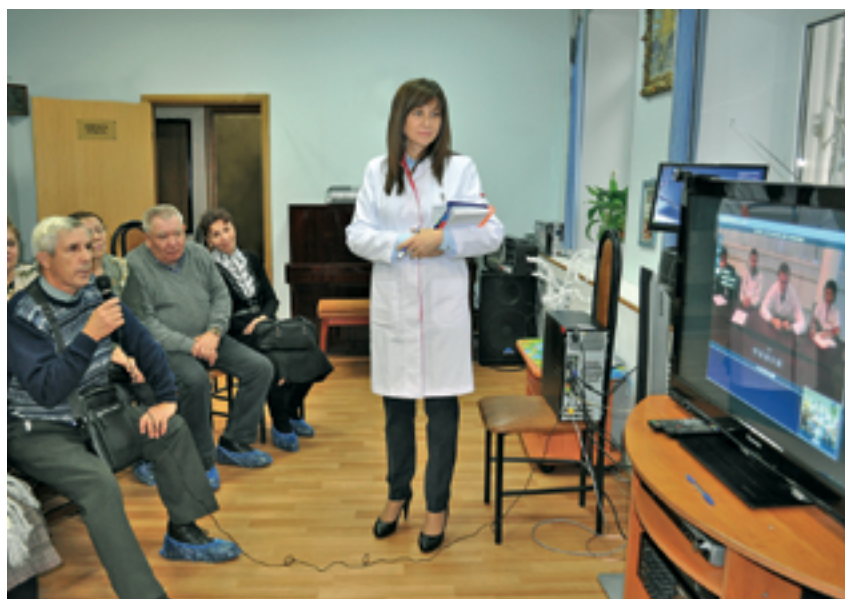
Одно из направлений реализации программы «Мы в сети»

Разработка данной модели только начата в рамках опытно-экспериментальных площадок, функционирующих на базе структурных подразделений ТЦСО «Ярославский»: фи-