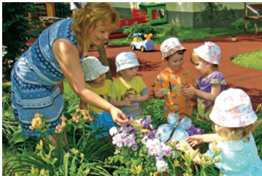
Игра в сказку с маленькими воспитанниками