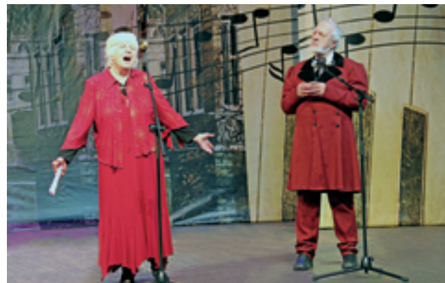
Победители Смотра-конкурса коллектив «Гармония»