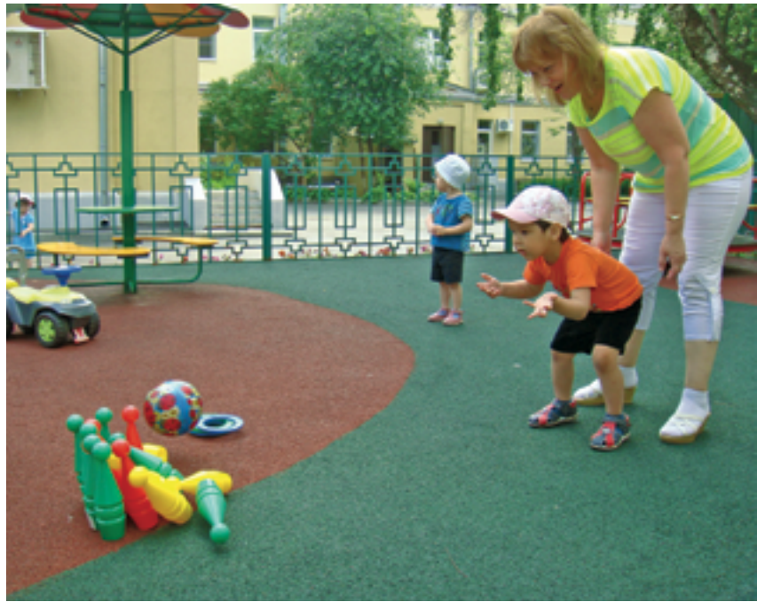
Главное для каждого ребенка — быть счастливым