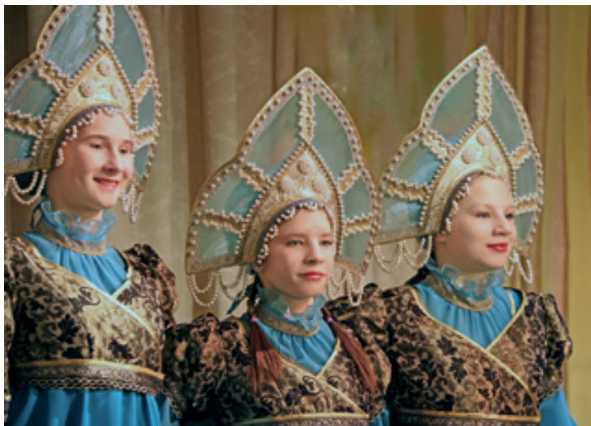
На сцене — коллектив «Ритмы планеты»

тов. И вот совсем скоро дети переселяются в свой новый дом.