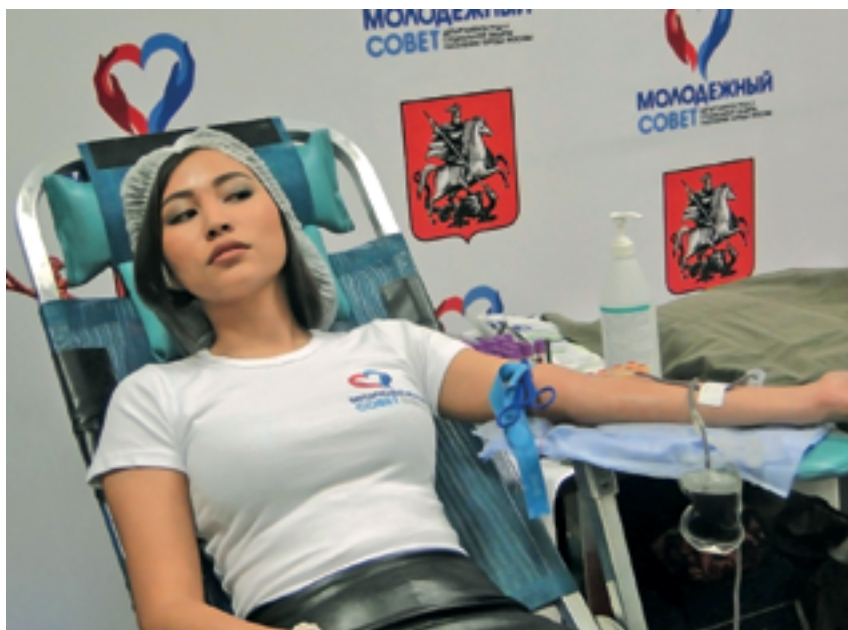
Члены Молодежного Совета планируют сделать мероприятие ежеквартальным

Инициативу молодежи поддержали не только заместитель руководителя и начальники Управлений Департамента тру-