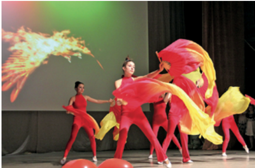
Главное событие праздника — концерт, подготовленный ребятами из многодетных семей

«Но и в учреждениях для детей-сирот городские власти стараются создать все условия для