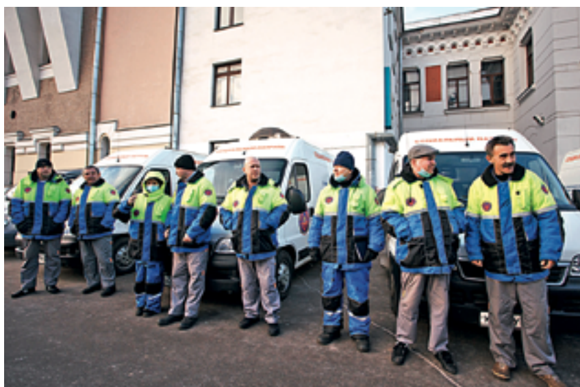
Сотрудники Мобильной службы «Социальный патруль» всегда готовы прийти на помощь

Опыт столицы в решении проблемы уличного бродяжничества весьма показателен — в городе созданы два центра социальной адаптации, рассчитанные на 1529 мест. Здесь оказывают круглосуточную помощь лицам без определенного места жительства и занятий. ГКУ «Центр социальной адаптации "Люблино"» имеет шесть территориальных отделений, в которые принимаются на временное пребывание граждане, оказавшиеся в критической жизненной ситуации. Не отказывают в помощи и иногородним, принимают людей без документов. В учреждениях всегда есть свободные места, организовано 400 койко-мест для ночлега. Еще одно подобное учреждение действует при ГБУ «Психоневрологический ин-