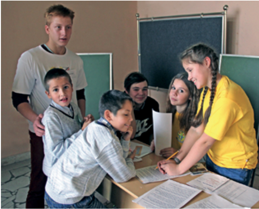
Увлекательные творческие занятия помогли ребятам лучше узнать самих себя

Академию, максимум на неделю, — рассказывает Константин Мирошник. — Обеспечиваются питанием и проживанием. Программа их пребывания очень