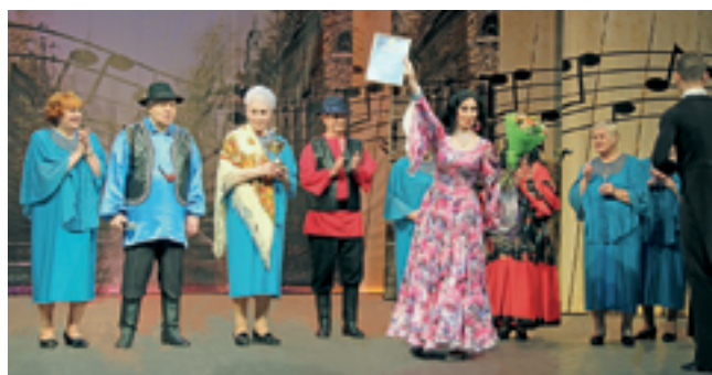
Ансамбль «Душа поет» ПВТ №19 — диплом в номинации «За лучший сценический образ»

Смотр-конкурс проводится уже много лет, начиная с 1999 года. Он создавался для того, чтобы привлечь внимание общественности и различных организаций к проблемам старшего поколения, к вопросам повышения эффективности культурно-досуговой работы и их социокультурной реабилитации. Проведение конкурса является одним из важнейших способов интеграции ветеранов войны и труда, инвалидов, пожилых людей в жизнь современного общества.