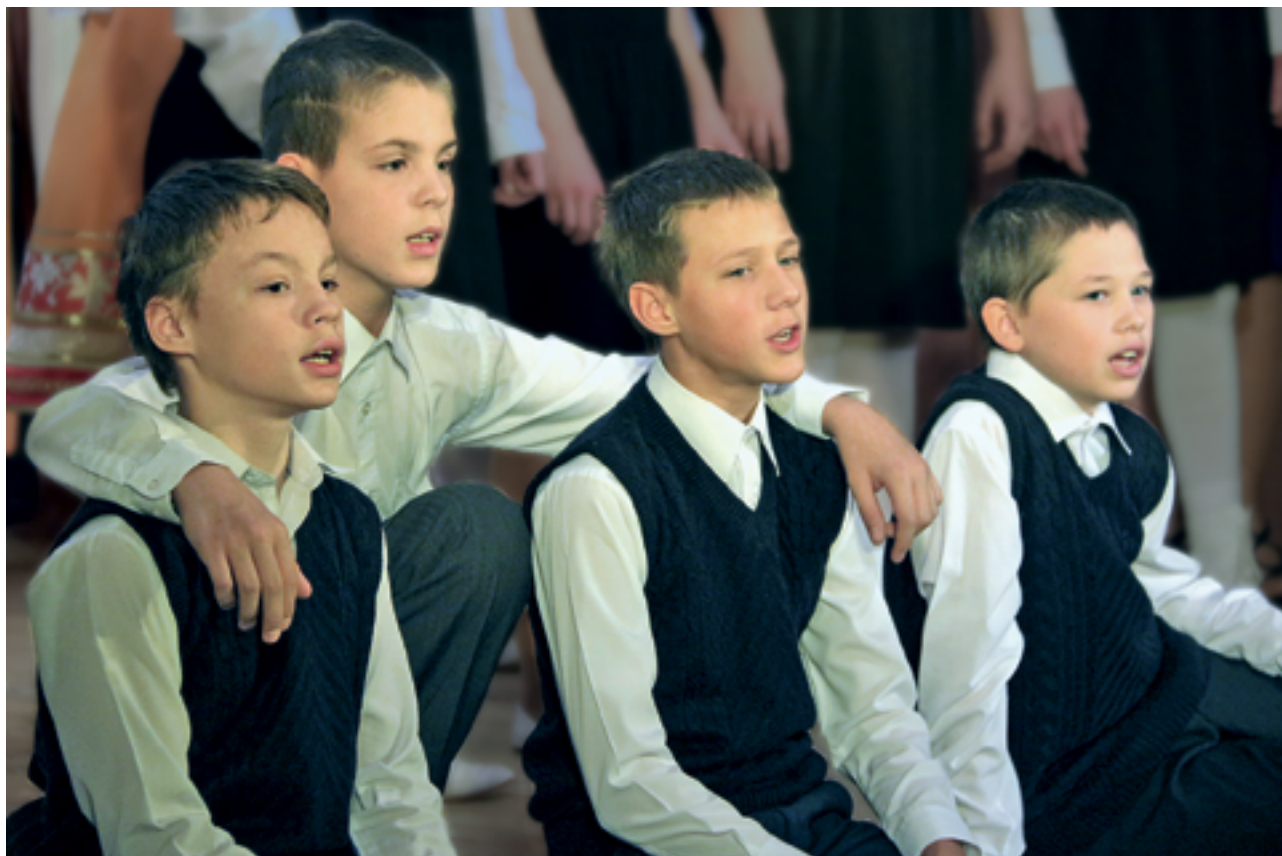
Воспитанники, занимающиеся в хоре «Исток»

Наталья Крушвиц