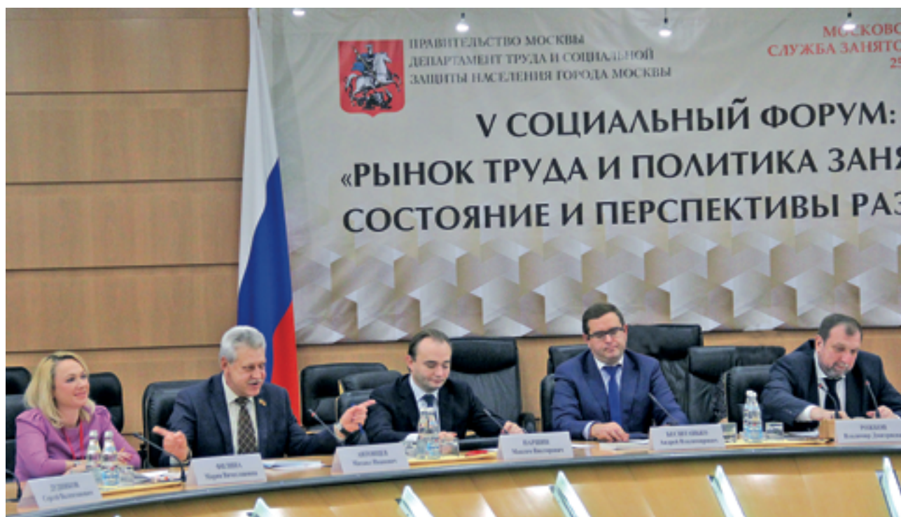
Мероприятие проходило в преддверии 25-летия Московской службы занятости

Поздравив Московскую службу занятости с четвертьвековым юбилеем, заместитель председателя Госдумы ФС РФ Андрей Исаев отметил, что она была создана раньше всех других служб занятости в субъектах РФ и оказала помощь сотням тысяч людей. Столица сегодня, несмотря на большое количество населения, является городом с самым низким уровнем безработицы не только в России, но и в мире, а это очень хороший, серьезный показатель, подчеркнул зампред.