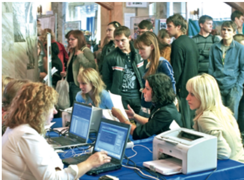
В Городском банке вакансий более 110 тыс. предложений по трудоустройству