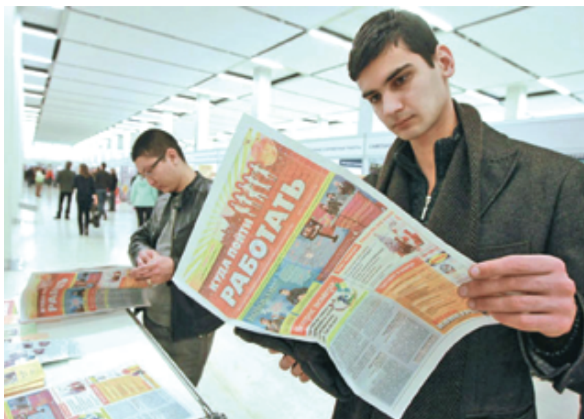
В столице сегодня самый низкий уровень безработицы

В конце октября на заседании Госдумы рассматривался отчет Правительства РФ о реализации плана первоочередных мероприятий по обеспечению устойчивого развития экономики и социальной стабильности в 2015 году. «Мы отме-