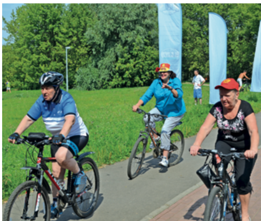
«Здоровый образ жизни — путь к долголетию»

В конце октября 2015 года заключен договор с Некоммерческим фондом помощи пожилым людям «Вечные ценности». Планируется совместная организация культурно-массовых мероприятий. Фонд плани-