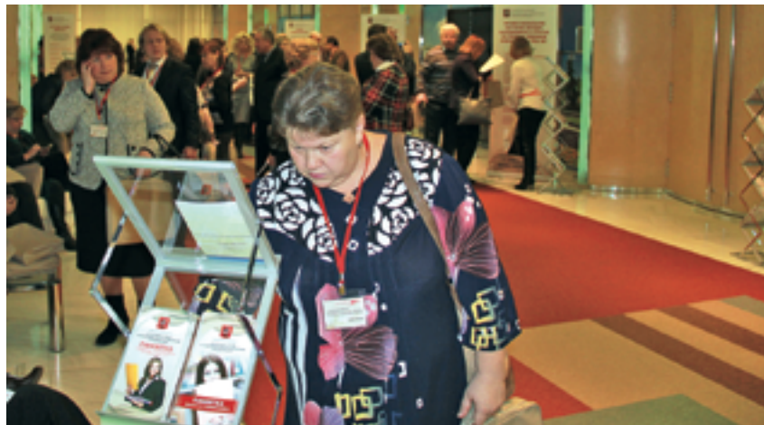
Форум — авторитетная площадка по обмену опытом и мнениями

мость учета происходящих там изменений. Регулируемый федеральным законодательством приток дешевой рабочей силы за счет мигрантов будет ограничен. Меняется ситуация и в регионах РФ — оплату труда, на которую жители регионов соглашались еще вчера, они находят у себя дома, выдвигая более высокие требования к столичным работодателям. Изменился менталитет молодого поколения — на первый план в системе ценностей всё больше выходят деньги, а че-