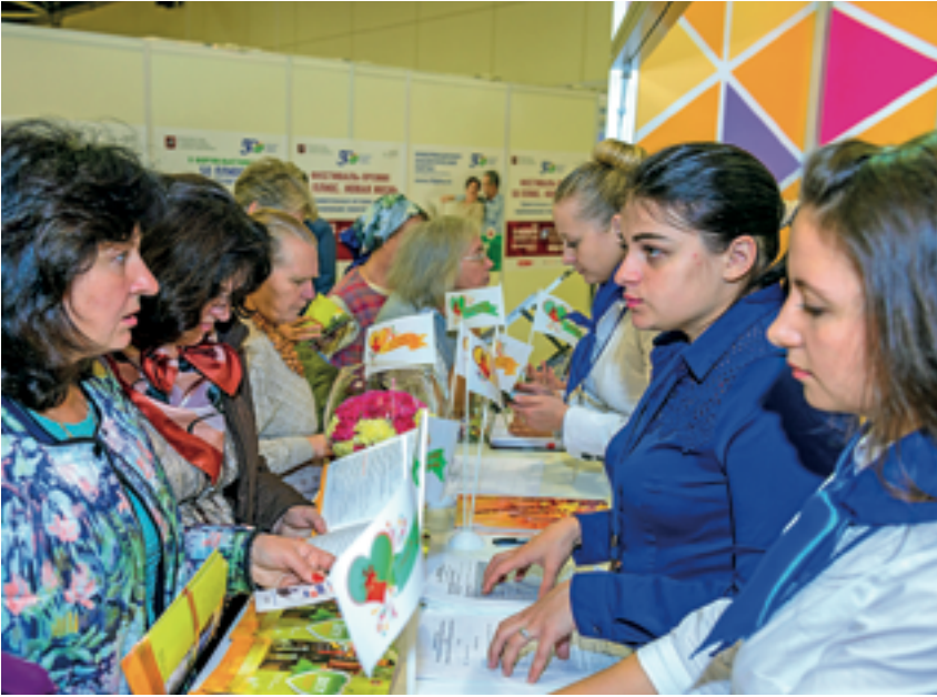
На стенде ДТСЗН города Москвы всегда многолюдно