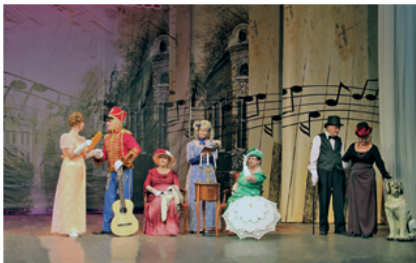
Театральная студия «Возрождение»

Лауреатом номинации «За лучший сценический костюм» стал ансамбль «Душа поет» Пансионата для ветеранов тру-