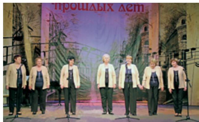
Обладатель Приза зрительских симпатий — коллектив «Вдохновение»

В этом году в мероприятии приняло участие около 800 ветеранов, что позволило этим активным и энергичным людям раскрыть таланты, поверить в свои способности, почувствовать собственную значимость и востребованность. А также продемонстрировать, что творчество — универсальный и доступный способ социальной реабилитации для любого возраста.